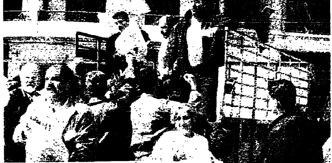
التوزيعات في الجديدة